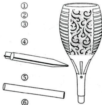
PL Ogrodowa lampa solarna LED Oryginalna instrukcja obsługi 99-057